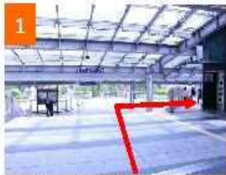
JR小倉駅の新幹線口(北口)方面より ペDESTリアンデッキを進む