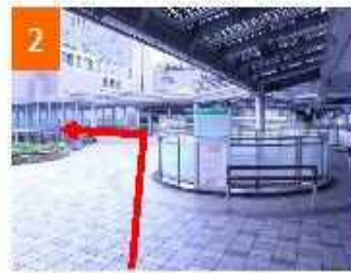
動く歩道に乗り終点まで進む