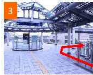
動く歩道の終点から右折する