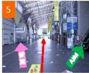
左手側が新館、右手側がAIM 本館と国際会議場は 突き当たりの出口まで直進