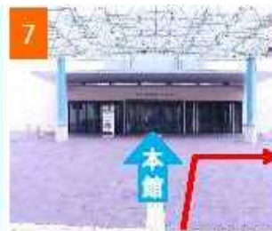
エスカレータを下りて正面が本館 国際会議場は右折