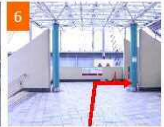
自動ドアを出て右手にある エスカレータを下りる