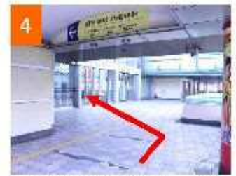
西日本総合展示場新館・AIMビル 入口から入る